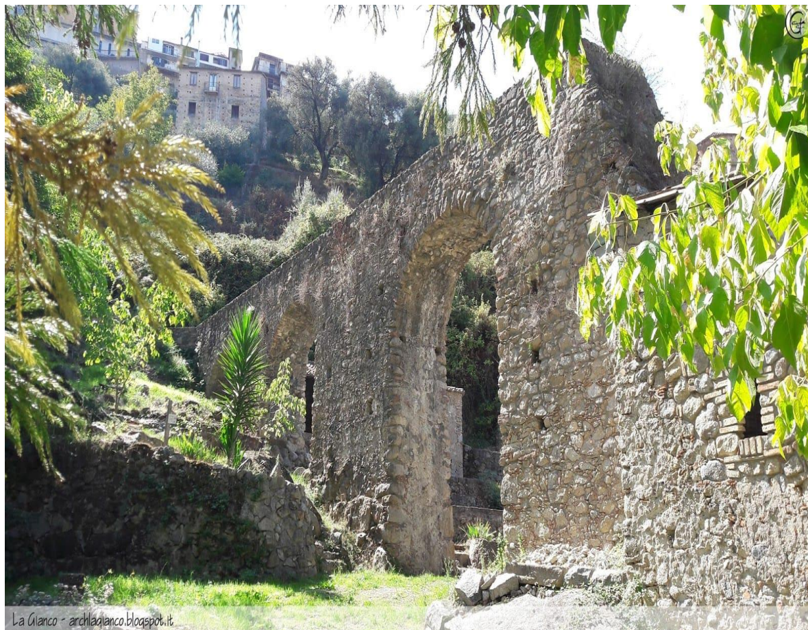
La Giano - archlagiano.blogspot.it