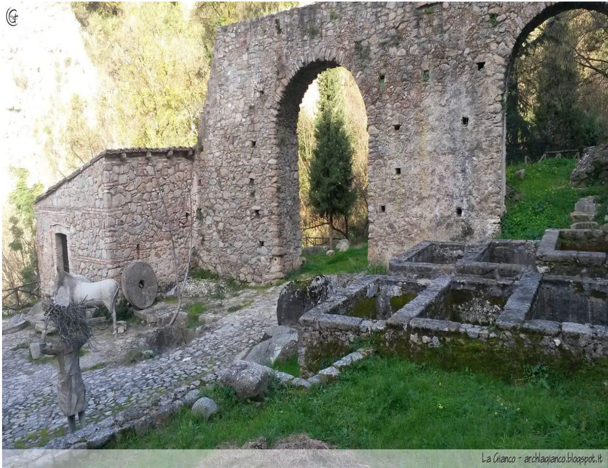
La Ciano